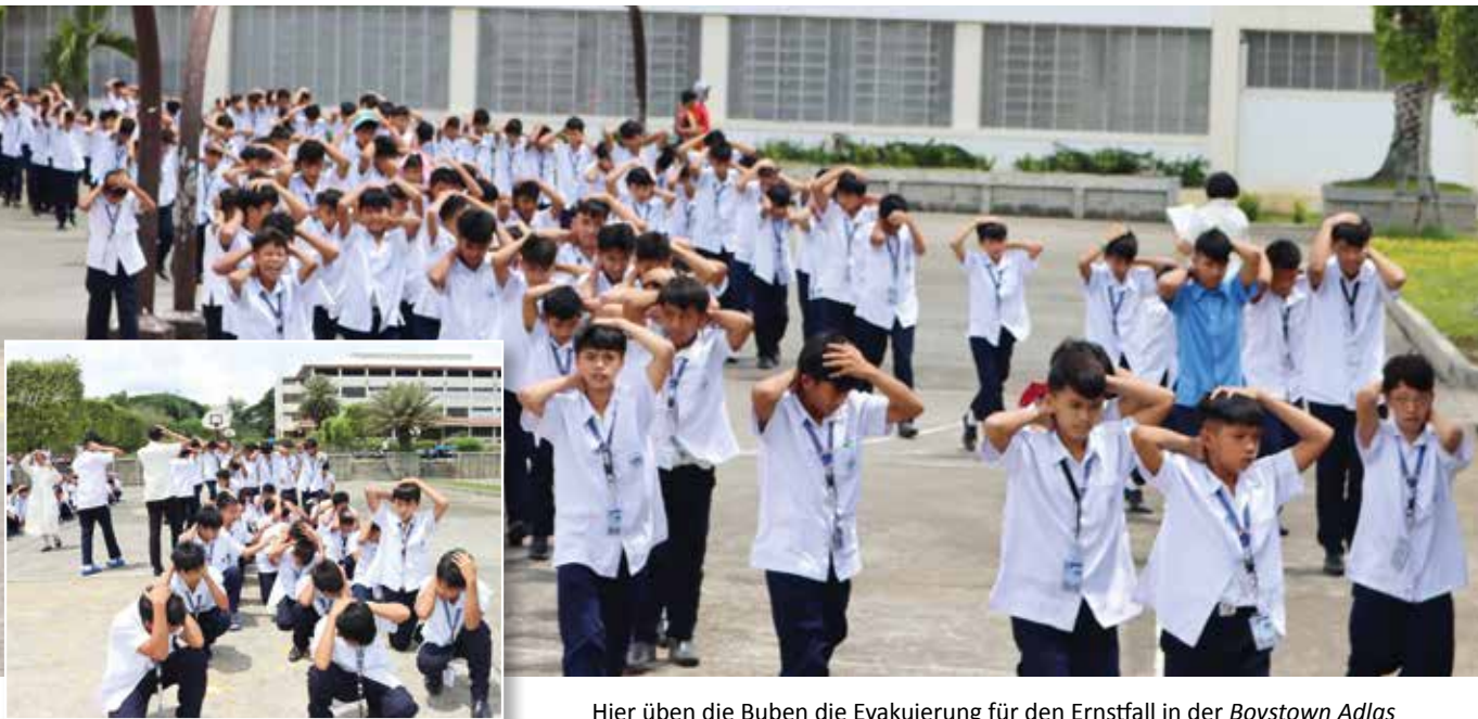
Hier üben die Buben die Evakuierung für den Ernstfall in der Boystown Atlas

Leider sind solche Naturkatastrophen auf den Inseln im pazifischen Ozean keine Seltenheit. 7.000 bis 8.000 Erdbeben erschüttern laut einer Statistik im Schnitt jährlich die Philippinen, darunter auch viele leichte. Bei den stärkeren schwingt manchmal die Angst mit, dass daraus ein Tsunami wird – der noch eine gewaltigere Zerstörung mit sich bringt.