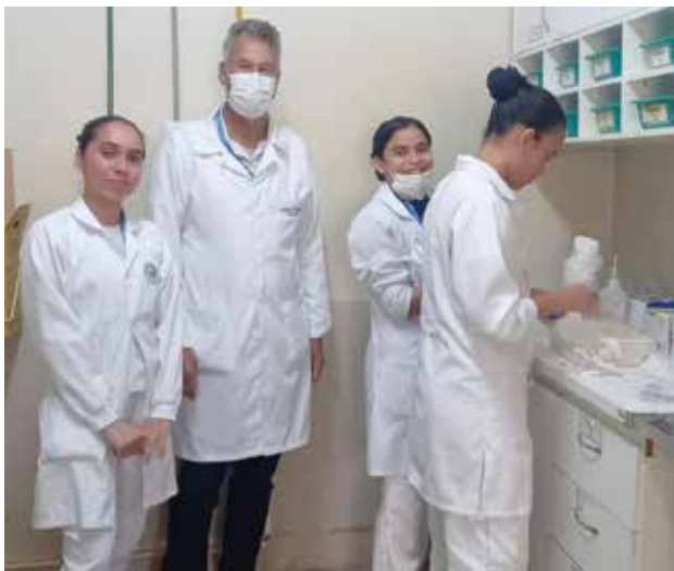
Einige Mädchen zusammen mit ihrem Ausbilder während der Pflegeausbildung in der Vila das Crianças de Maria

Vor wenigen Tagen gab es einen feierlichen Anlass in der Mädchenschule: 113 Absolventinnen nahmen voller Freude ihre Abschlusszeugnisse entgegen. Sechs Jahre gaben sie ihr Bestes im Unterricht und fieberten dabei auf diesen denkwürdigen Moment hin. Und nun haben sie es geschafft! 43 von ihnen schlossen ihre Ausbildung im Verwaltungsbereich ab. 70 Mädchen durften den medizinischen Kurs erfolgreich absolvieren. Voller Hoffnung und Zuversicht starten sie in das neue Lebenskapitel.